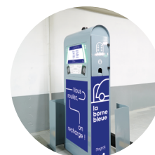
Borne de 22 kVA pour la recharge normale

Des bornes de type DIVA SP sont installées :