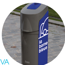
Borne de 3,7 à 7,4 kVA pour la recharge lente

Le matériel Autolib' est remis en service dans une logique de développement durable et une gestion raisonnée.