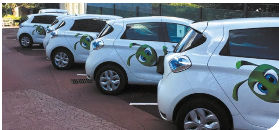
Ici le parc de véhicules électriques récemment acquis par la ville de Rosny-sous-Bois